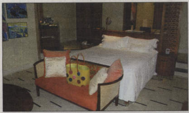
Elke slaapkamer het 'n see-uitsig en is uiters luuks.