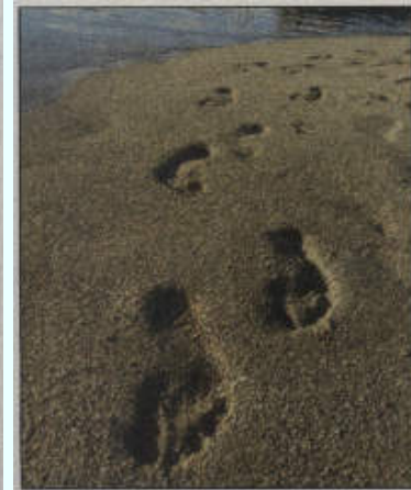
Romanties op die strand.

Nog 'n eiland waar die aktrise Liv Tyler glo al deurnag gekuier het nadat sy haar boot gemis het, is